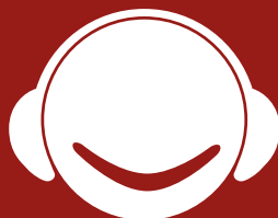
PRÉVENTION DES RISQUES AUDITIFS