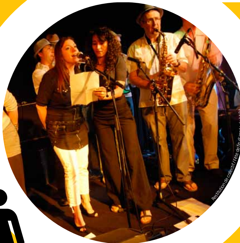
Restitution de collectif / Fête de fin d'année de l'ARA